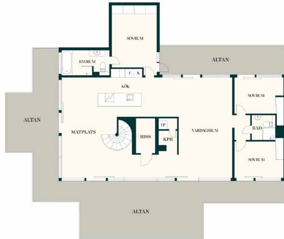
RESIDENCE CHRISTIE'S Med reservation för avvikelser